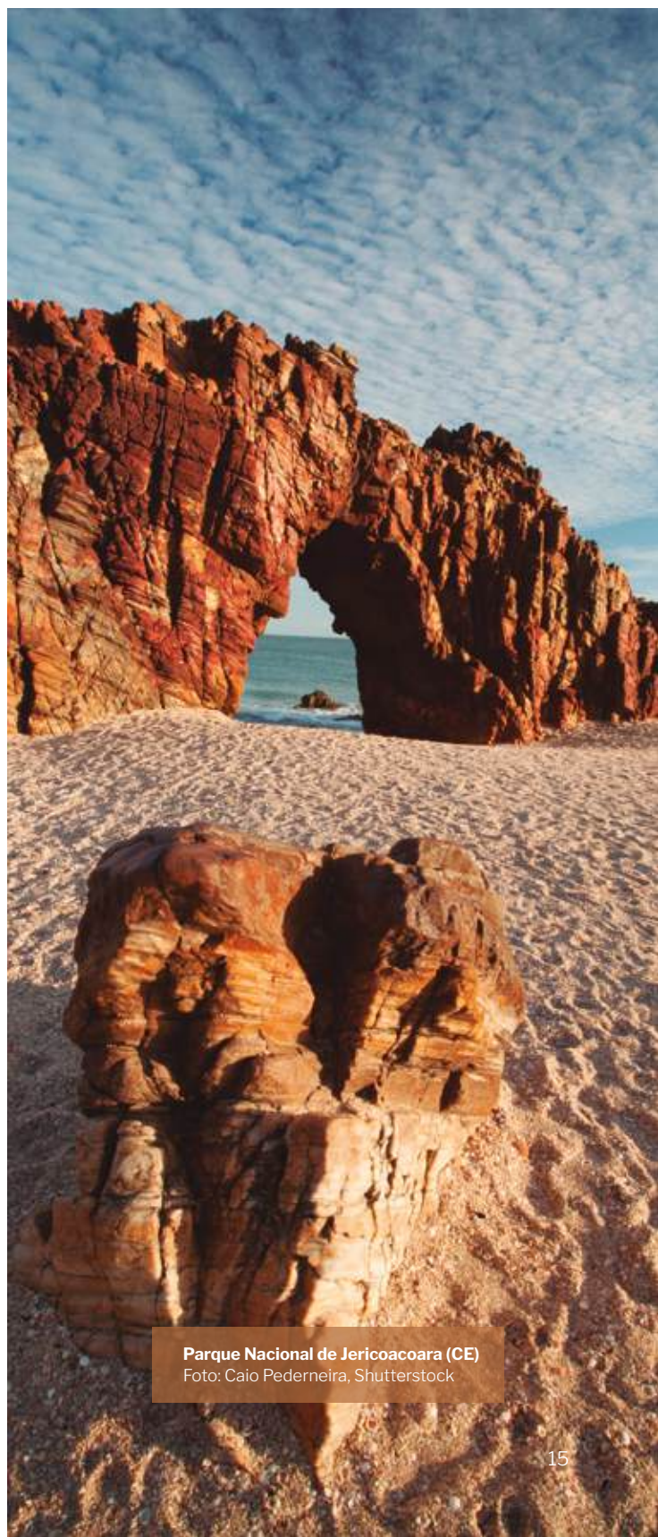
Parque Nacional de Jericoacoara (CE)

No Brasil, recomenda-se o alinhamento de visões e estratégias em âmbito nacional entre as pastas de economia, turismo e meio ambiente. Significa ser necessário estabelecer uma governança articulada e efetiva entre esses entes, assim como priorizar o planejamento e a execução de investimentos para desenvolver o ecoturismo no país, com início pelo turismo responsável nos Parques do Brasil.