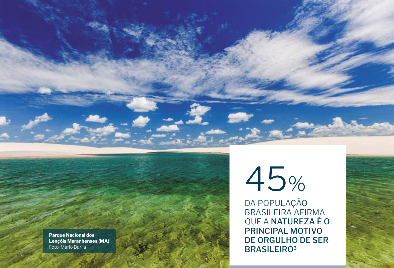
Parque Nacional dos Lençóis Maranhenses (MA)

45% DA POPULAÇÃO BRASILEIRA AFIRMA QUE A NATUREZA É O PRINCIPAL MOTIVO DE ORGULHO DE SER BRASILEIRO 3