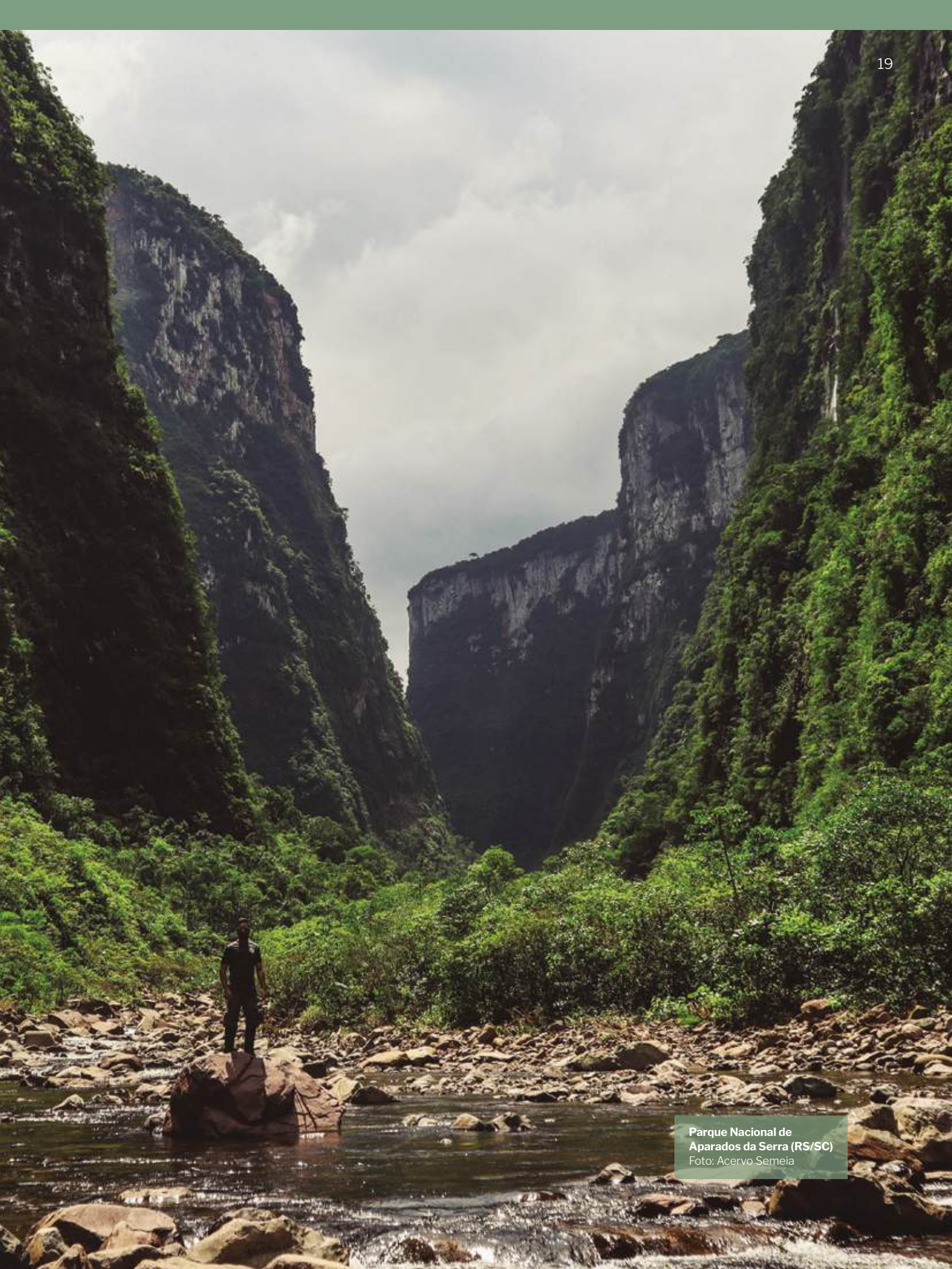
Parque Nacional de Aparados da Serra (RS/SC)