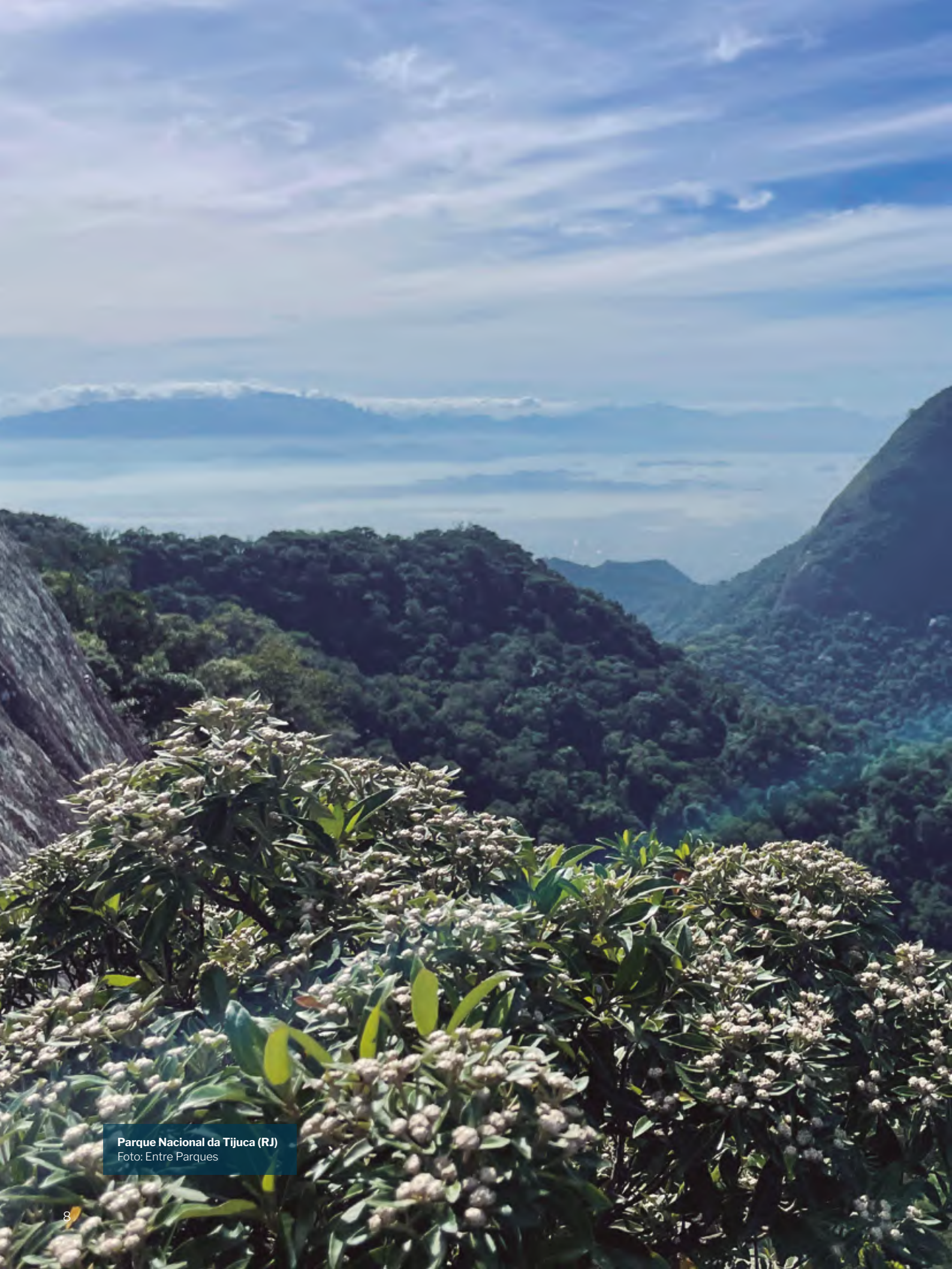
Parque Nacional da Tijuca (RJ)