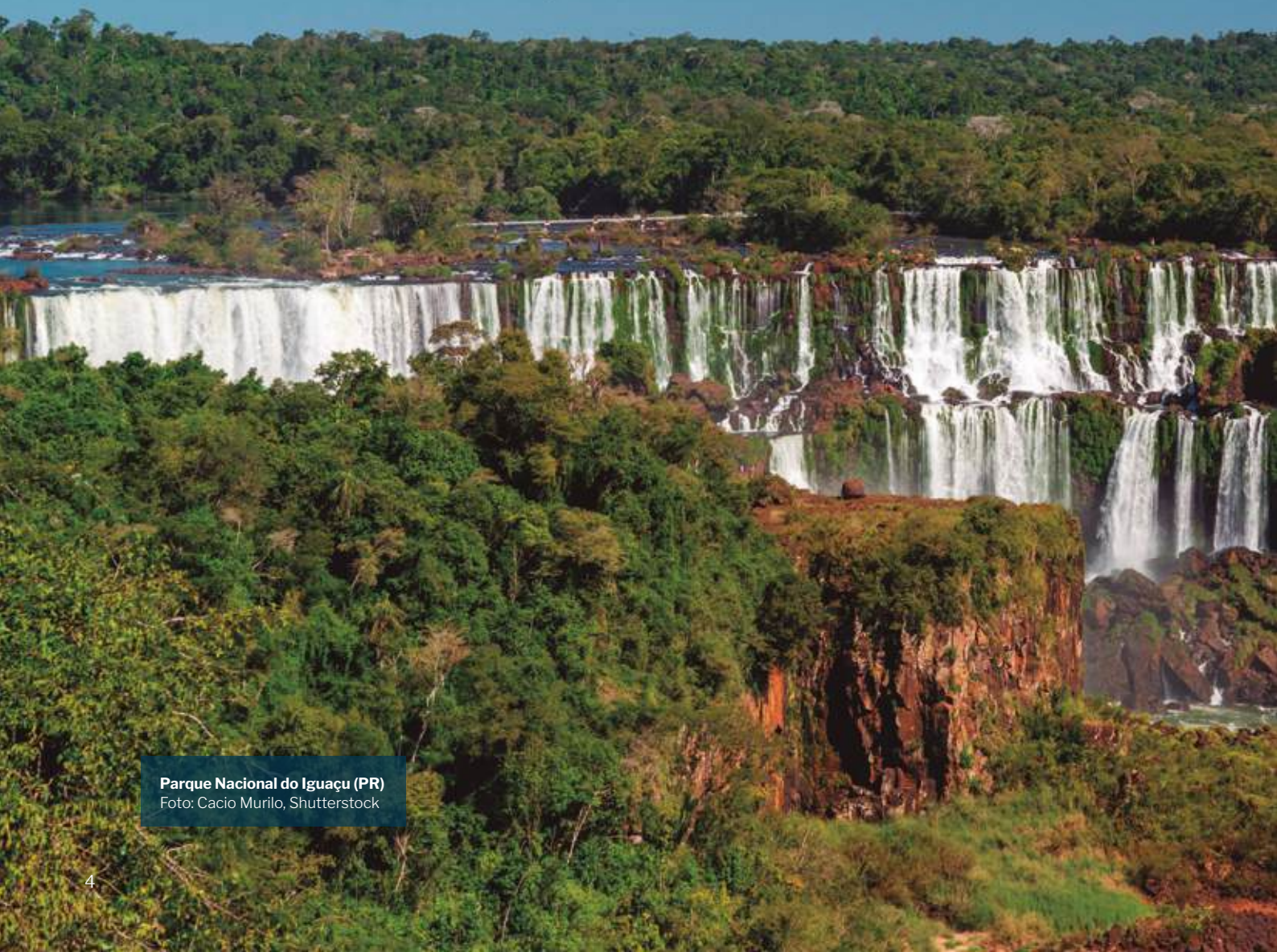
Parque Nacional do Iguaçu (PR)

de tudo, opções não faltam. São cânions, rios, cachoeiras, cataratas, cadeias de montanhas, cavernas, pinturas rupestres, florestas presentes nos seis biomas brasileiros. Poucos países têm biomas e ecossistemas como o Brasil. Precisamos aproveitar nossa vocação natural para que os nossos Parques sejam vetores de desenvolvimento do ecoturismo responsável e sustentável.